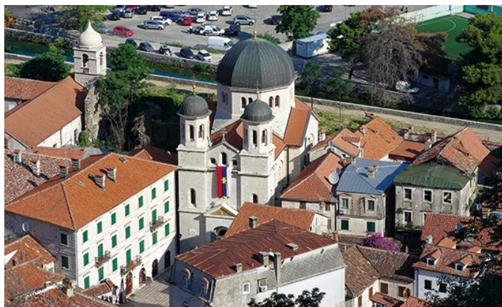
▲ Cerkiew św. Mikołaja

i 1 IX–14 X pn.–pt. 8.00–18.00, sb.–nd. 9.00–13.00; 4 EUR, dzieci 1 EUR, prezentujące dość ciekawą, różnorodną ekspozycję. Główną jej część stanowi sala poświęcona żegludze i marynarce z XVI–XVIII w., z czasów największej świetności floty i marynarki bokotorskiej. Sporo tu urządzeń nawigacyjnych, map, rycin przedstawiających Kotor i inne miasta czarnogórskiego Primorja, modeli statków, malarstwa marynistycznego oraz portretów Primorjan. Osobna część poświę-