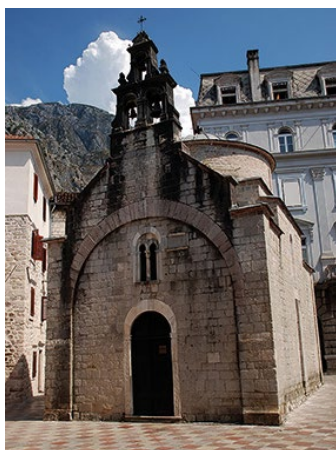
▲ Cerkiew św. Łukasza

Kierując się na południe, wchodzimy na gwarny plac z kawiarenkami, Trg Bokeljske mornarice. Znajduje się tu XVIII-wieczny, barokowy pałac Grgurin (Palata Grgurin), w którym mieści się Muzeum Pomorskie 📍 Pomorski muzej Crne Gore, VII–VIII pn.–pt. 8.00–23.00, sb.–nd. 10.00–16.00, 15 IV–30 VI