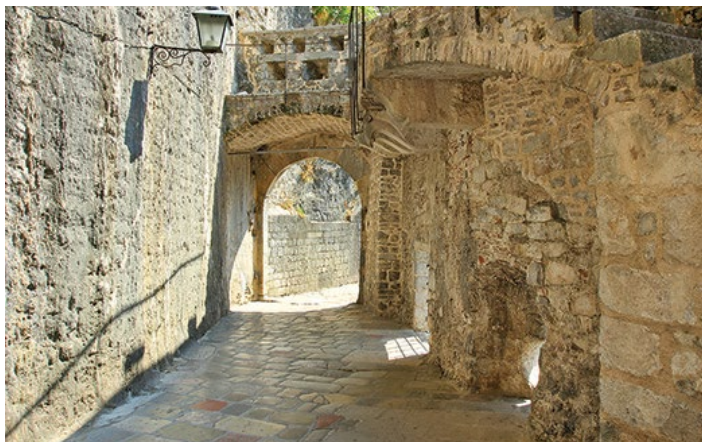
▲ Uliczka w Kotorze

Nawę główną, zamkniętą od wschodu półokrągłą apsydą, oddzielają od naw bocznych szeregi masywnych filarów i kolumn. Fasadę zachodnią wieńczą dwie wieżo-dzwonnice. Trzęsienie ziemi, które nawiedziło Kotor w XVI w., poważnie uszkodziło budowlę. Z tego też powodu katedrę przebudowano na przełomie XVI i XVII w., nadając jej renesansowo-barokowy wygląd. Usunięto kopułę i zamalowano freski. Podczas kolejnego trzęsienia ziemi, w 1667 r. zniszczeniu uległa zachodnia część świątyni, wraz z obiema wieżami, które odbudowano w stylu barokowym, dodając łączący je taras. Fasada zachodnia otrzymała rozetę i portal. Po ostatnim trzęsieniu ziemi, w 1979 r. świątyni przywrócono pierwotny, romański wygląd.